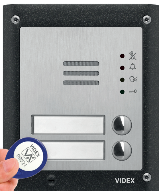
4810-2/M con kit installazione da superficie ad 1 modulo 4881