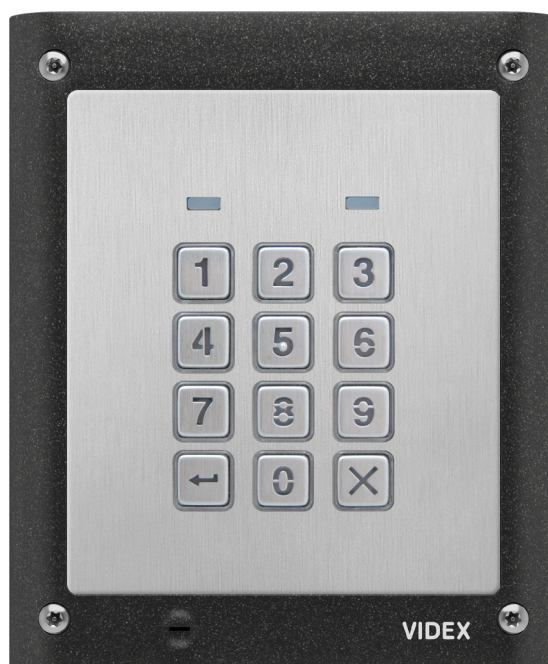
4903/M con kit di installazione a parete da 1 modulo 4881